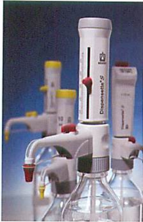
【ディスペンセットS】