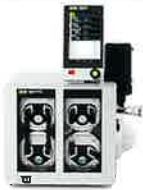
ダイヤフラムポンプ V-603Pro