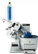
ロータリーエバポレーター R-300 単体