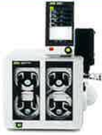
ダイヤフラムポンプ V-603Pro